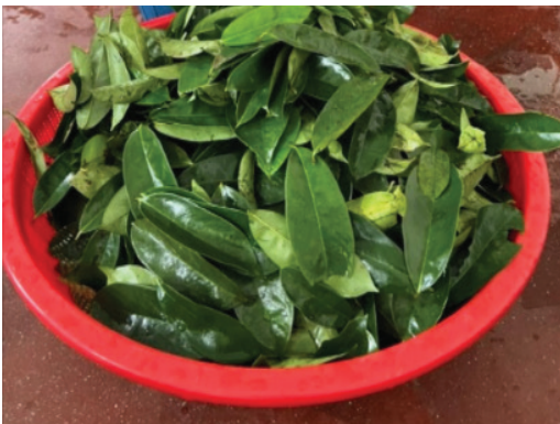
Gambar 1. Daun durian Belanda segar

Sehubungan itu, kajian ini dilaksanakan melalui kerjasama antara MARDI dan usahawan bimbingan MARDI bagi membangunkan produk tisane daun durian Belanda yang selamat untuk dimakan dan berkualiti tinggi. Kajian ini turut melibatkan penilaian awal terhadap tahap pencemaran mikrob dan pestisid dalam produk tisane daun durian Belanda ( Gambar 2 ) sedia ada di pasaran sebagai perbandingan. Secara khusus, objektif kajian ini adalah untuk membangunkan Prosedur Operasi Standard (SOP) pemprosesan tisane daun durian Belanda dengan kehadiran mikroorganisma pada aras selamat untuk dimakan dan mematuhi had maksimum yang dibenarkan merangkumi peringkat penerimaan, pembersihan, pengeringan dan penyimpanan bagi memastikan produk akhir memenuhi keperluan keselamatan makanan dan sesuai untuk kegunaan pengguna.