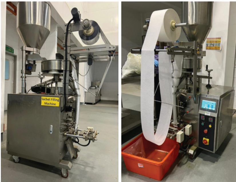
Gambar 3. Horizontal automatic filling machine yang digunakan untuk membungkus teh uncang

tisane daun durian Belanda dibungkus ke dalam pek individu yang diperbuat daripada polyethylene terephthalate /aluminum/ polyethylene (PET/Al/PE) dan dipateri ( seal ). Pek PET/Al/PE yang digunakan bersaiz 8.0 cm × 8.0 cm (lebar × tinggi) dengan ketebalan 100 micron , reka bentuk flat bottom pillow design , berkapasiti 2 g dan bergred makanan. Pek individu (20 pek) tersebut dimasukkan ke dalam kotak berukuran 16 cm (panjang) × 6.5 cm (lebar) × 7.5 cm (tinggi) ( Gambar rajah 1 ). Selain pembungkusan berbentuk kotak, uncang tisane (10 – 15 uncang) boleh juga dimasukkan ke dalam pek aluminium standing pouch (PET/Al/PE) yang bersaiz 15 cm (panjang) × 5 cm (lebar) × 22.5 cm (tinggi) dan dipateri. Bungkusan tisane daun durian Belanda disimpan pada suhu bilik (~25 °C) di ruang yang mempunyai sistem pengudaraan, kelembapan dan pencahayaan yang baik dan sesuai. Langkah-langkah (SOP) pemprosesan, pengeringan dan pembungkusan tisane daun durian Belanda yang ditambah baik daripada kaedah sedia ada oleh usahawan adalah seperti dalam Carta alir 2 . Seterusnya, ujian kawalan kualiti ke atas produk meliputi analisis fizikokimia dan mikrobiologi dilaksanakan.