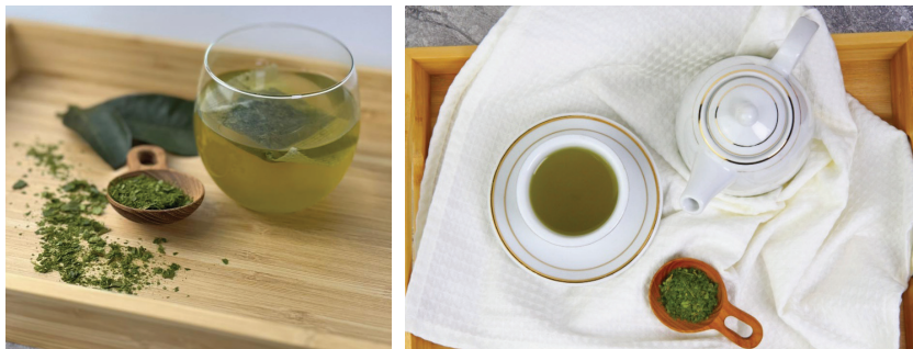
Gambar 4. Tisane daun durian Belanda yang dihasilkan di MARDI

Bagi analisis yis dan kulat, kedua-dua tisane MARDI dan usahawan mencatatkan nilai kurang daripada 3.00 log CFU/g yang menunjukkan tahap pencemaran kulat yang rendah dan pada aras selamat. Ini berkait rapat dengan nilai aktiviti air ( A_w ) yang rendah (<0.50) yang tidak menggalakkan pertumbuhan yis dan kulat. Analisis jumlah koliform dan E. coli bagi tisane MARDI menunjukkan nilai <1.00 log CFU/g, berbanding dengan tisane usahawan yang mencatat cerapan lebih 3 log CFU/g bagi koliform. Cerapan pertumbuhan sifar bagi koliform dan E. coli ini mencerminkan amalan kebersihan dan sanitasi yang baik semasa proses pengendalian dan pemprosesan tisane daun durian Belanda MARDI.