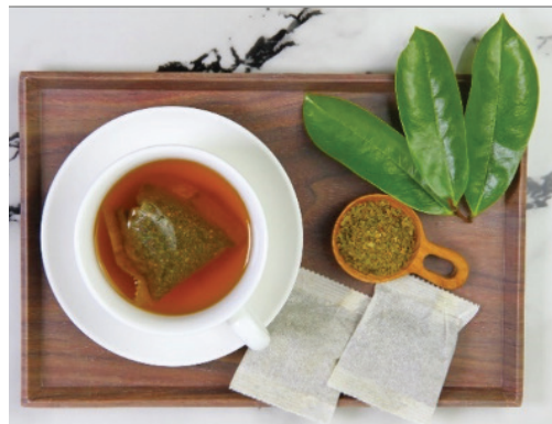
Gambar 2. Tisane daun durian Belanda yang dihasilkan oleh usahawan