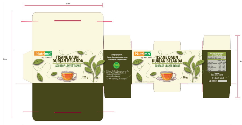
Gambar rajah 1. Reka bentuk kotak pembungkusan bagi pek individu tisane daun durian Belanda