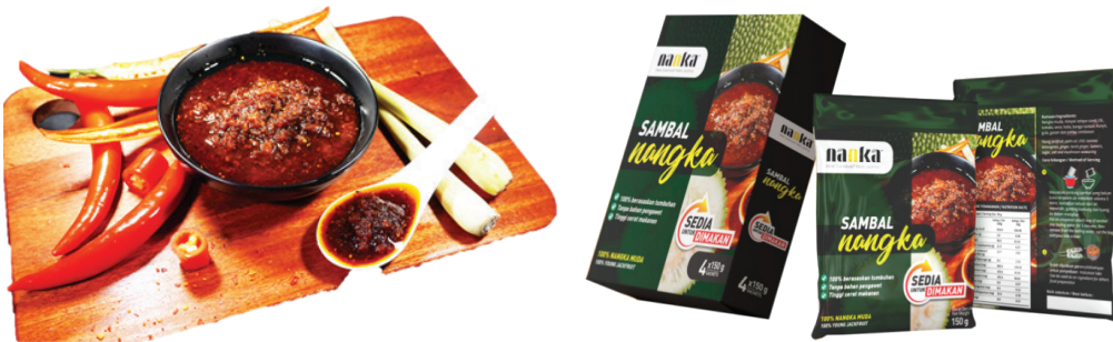
Gambar 1. Sambal nangka (kiri) dan pembungkusan retort sambal nangka (kanan)